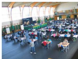
Športna dvorana Ig