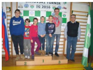
Na turnirju 2016 so nastopili poleg najmlajših tudi mladinci in mladinke ŠK Ig.