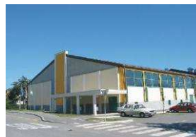
Športna dvorana Ig