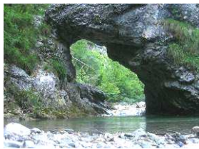
Votli kamen v lškem Vintgarju